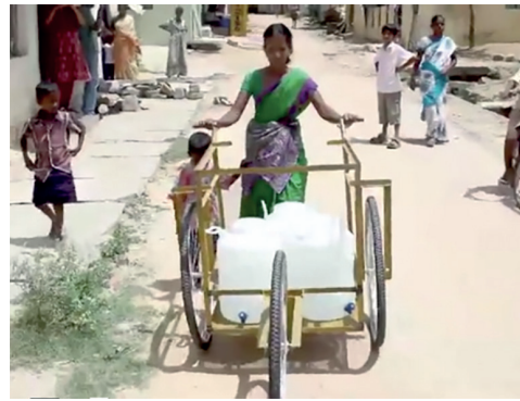
Figura 11: Carrito para transportar agua de IDEO