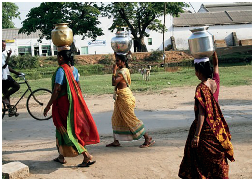
Figura 10: Forma tradicional de transportar agua

Una forma de mejorar el acceso al agua fue el carrito transportador, fabricado con materiales de la zona fáciles de obtener. IDEO colaboró con artesanos locales para modelar varias opciones de diseño, como se puede ver en las figuras 11 y 12 .