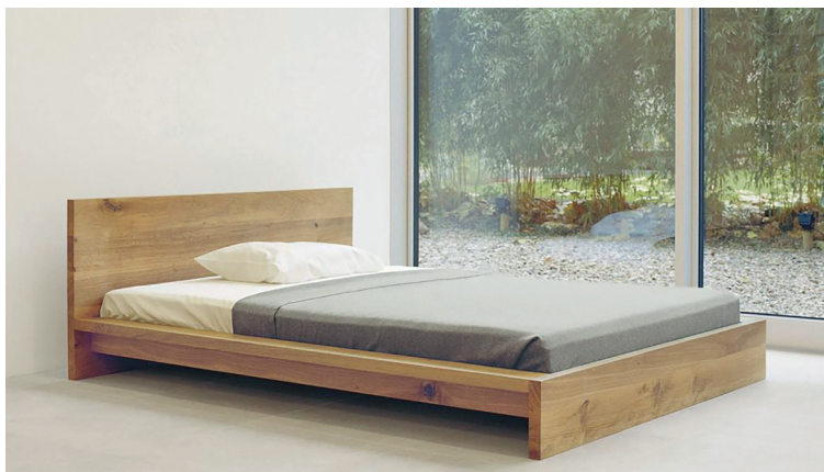
Figura 6: cama Mo SL02 de e15