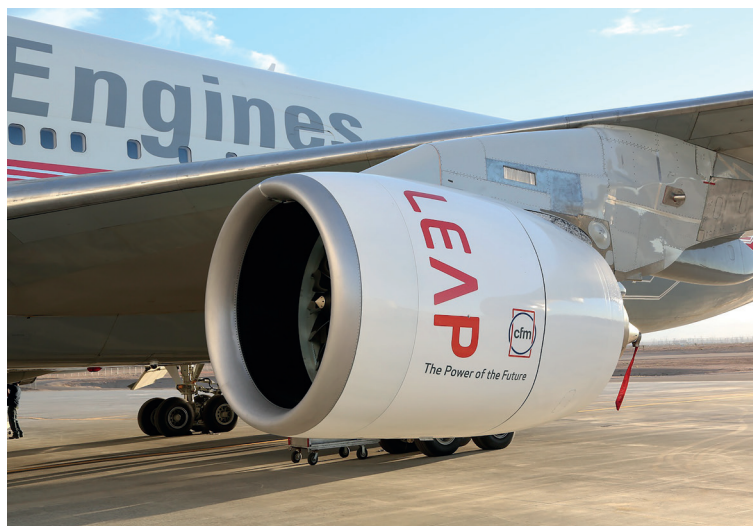
Figura 3: Motor LEAP

La serie LEAP de motores para aeronaves, véase la Figura 3 , es la primera que contiene componentes impresos en 3D, véase la Figura 4 . También es la primera en recibir una certificación tanto por parte de la Administración Federal de Aviación como por la Agencia Europea de Seguridad Aérea.