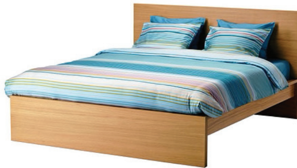
Figura 5: Cama Malm de IKEA