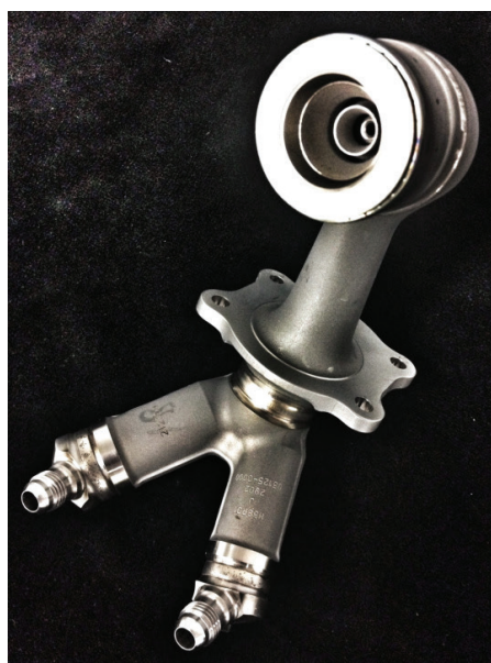
Figura 4: Boquilla de combustible de un motor LEAP impresa en 3D