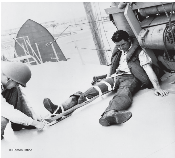
Figura 7: Férula Eames en uso