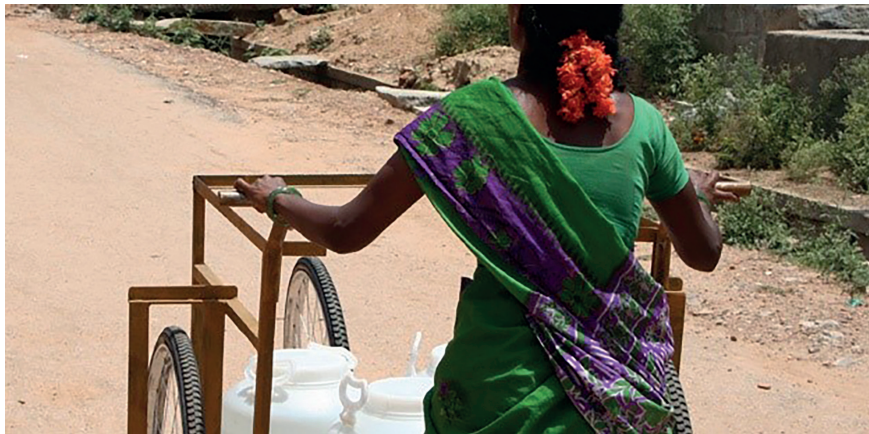
Figura 12: Carrito para transportar agua de IDEO