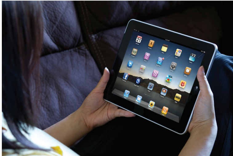
Figura 9: Apple iPad

El iPad se calificó como competidor de los computadores portátiles y fue el primer producto de su clase en difundirse en el mercado. Aunque el iPad es un producto relativamente nuevo, ya se reconoce como un diseño clásico.